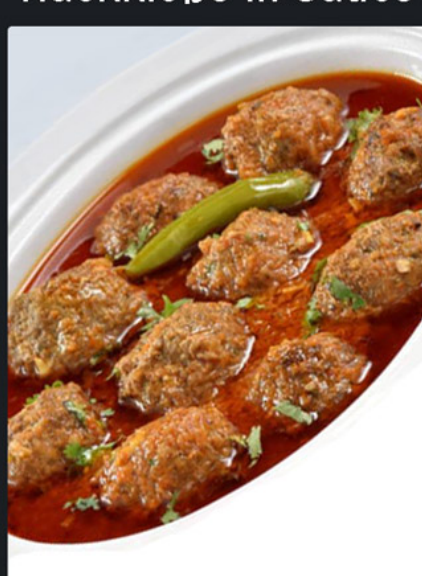
Hackklöße in Sauce

Hackfleisch, Zwiebeln, Tomaten, Olivenöl, Salz, Currysauce und Pfeffer