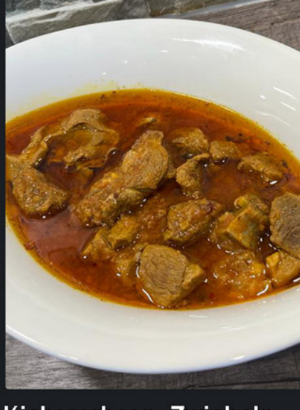
Lammfleisch in Sauce

Kichererbsen, Zwiebeln, Knoblauch, Öl, Kurkuma, Salz, Pfeffer