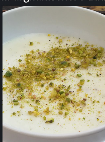
Firni afghanischer Pudding

Mandeln, Pistazien, Milch, Zucker und Kardamom